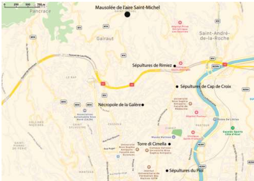
fig. 1 : Localisation du site du mausolée de l'aire Saint-Michel

Si la présence de sépultures confirme la nature funéraire du site, il est assez difficile de définir quel type d'édifice s'élevait sur les fondations mises au jour à partir de la documentation à disposition. S'agit-il d'un mausolée, d'une tour, d'une pile ou simplement d'un enclos funéraire qui renfermait ou non le mausolée proprement dit ?