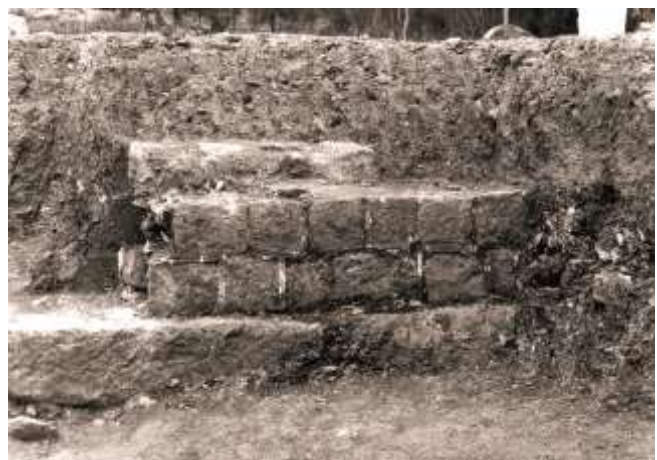
fig. 3 : Parement interne du mur sud-est/nord-ouest du mausolée en cours de fouille (Musée de Cimiez)