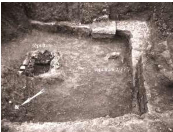
fig. 2 : Mausolée de l'aire Saint-Michel en cours de fouille (Musée de Cimiez)