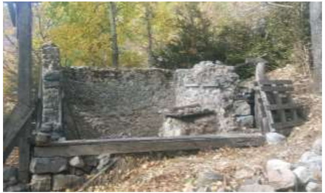
fig. 4, 5 : Vues générales de la chapelle