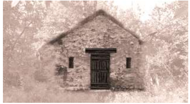
fig. 12 : Essai de restitution de la chapelle