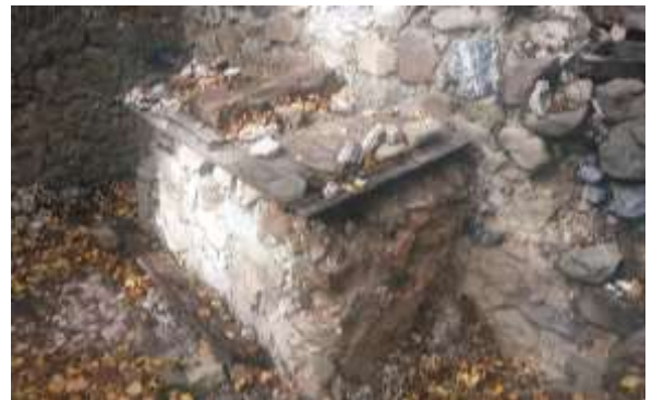
fig. 9 : L'autel en pierres appuyé au mur du chevet de la chapelle