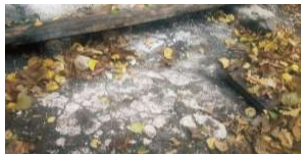
fig. 10 : Revêtement en plâtre du sol devant l'autel