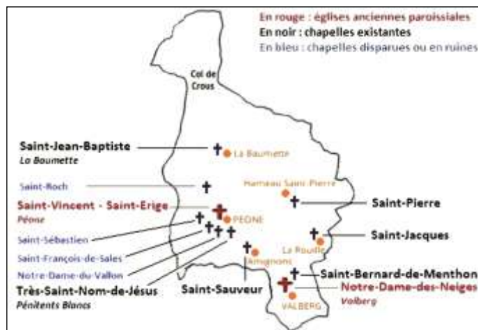
fig. 1 : Répartition géographique des édifices religieux de Péone

- dix chapelles : Saint-Nom-de-Jésus (Pénitents Blancs) au village bâtie au XVII e s., Saint-Bernard-de-Menthon à Valberg construite en 1935, Saint-Jacques au hameau de La Rouille (Roya) édifée au XVII e s., Saint-Jean-Baptiste au hameau de La Baumette construite en 1635, Saint-Pierre au hameau Saint-Pierre d'Aygue Blanche élevée vers 1680, Saint-Sauveur aux Amignons érigée au XVII e s., Notre-Dame-des-Grâces dite du Vallon à proximité du cimetière du village 7 , de date inconnue et disparue au plus tard au XIX e s., Saint-Sébastien 8 aux abords du village, de date inconnue et disparue au plus tard au XIX e s., Saint-François-de-Sales 9 sur la place du village, construite en 1712 et détruite au XIX e s., Saint-Roch au quartier du Chardonnier sur la rive droite du Tuébi, élevée en 1631, aujourd'hui en ruines et objet du présent travail.