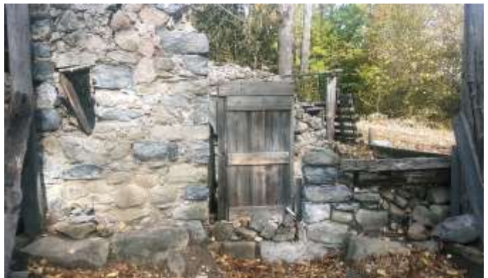
fig. 6, 7 : Vues de la façade très dégradée