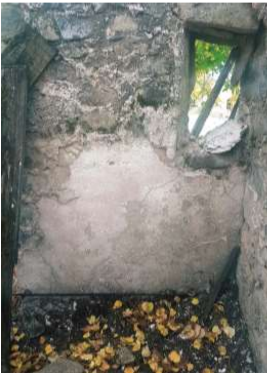
fig. 8 : Face interne du mur de façade