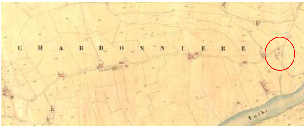
fig. 3 : Localisation cadastrale de la chapelle Saint-Roch