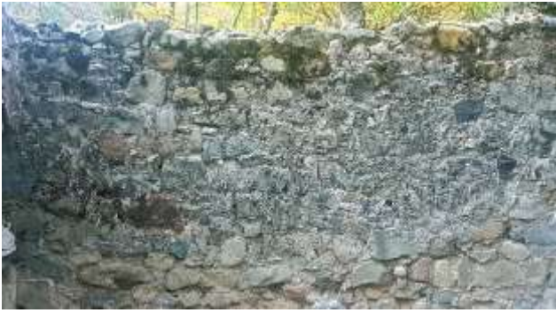
fig. 11 : Détail du mur gouttereau gauche